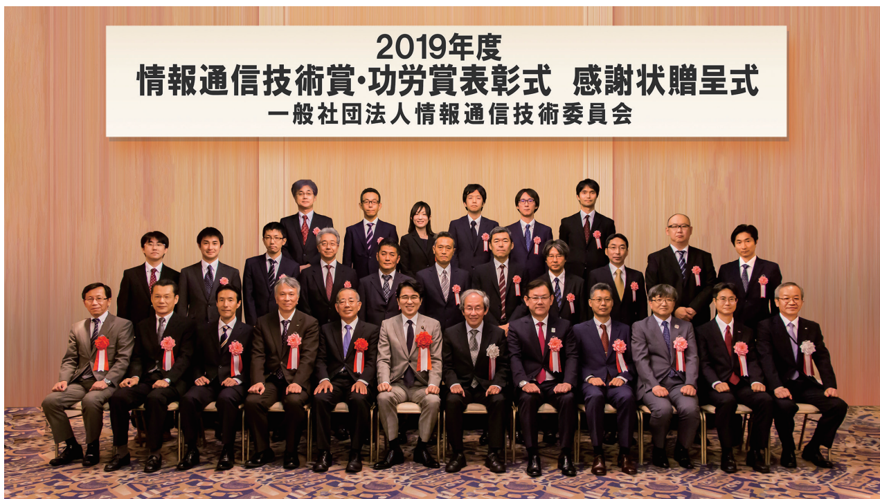
総務大臣表彰・TTC会長表彰・功労賞受賞の皆様