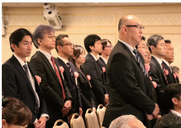
功労賞受賞の皆様