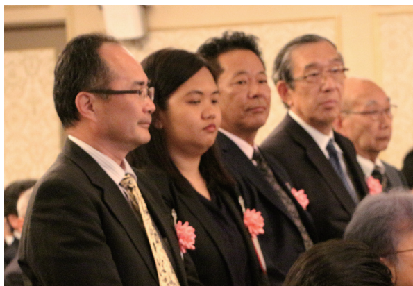
コネクテッド・カー専門委員会 「災害時に自動車を用いた情報通信システム」 標準化作業チームの皆様