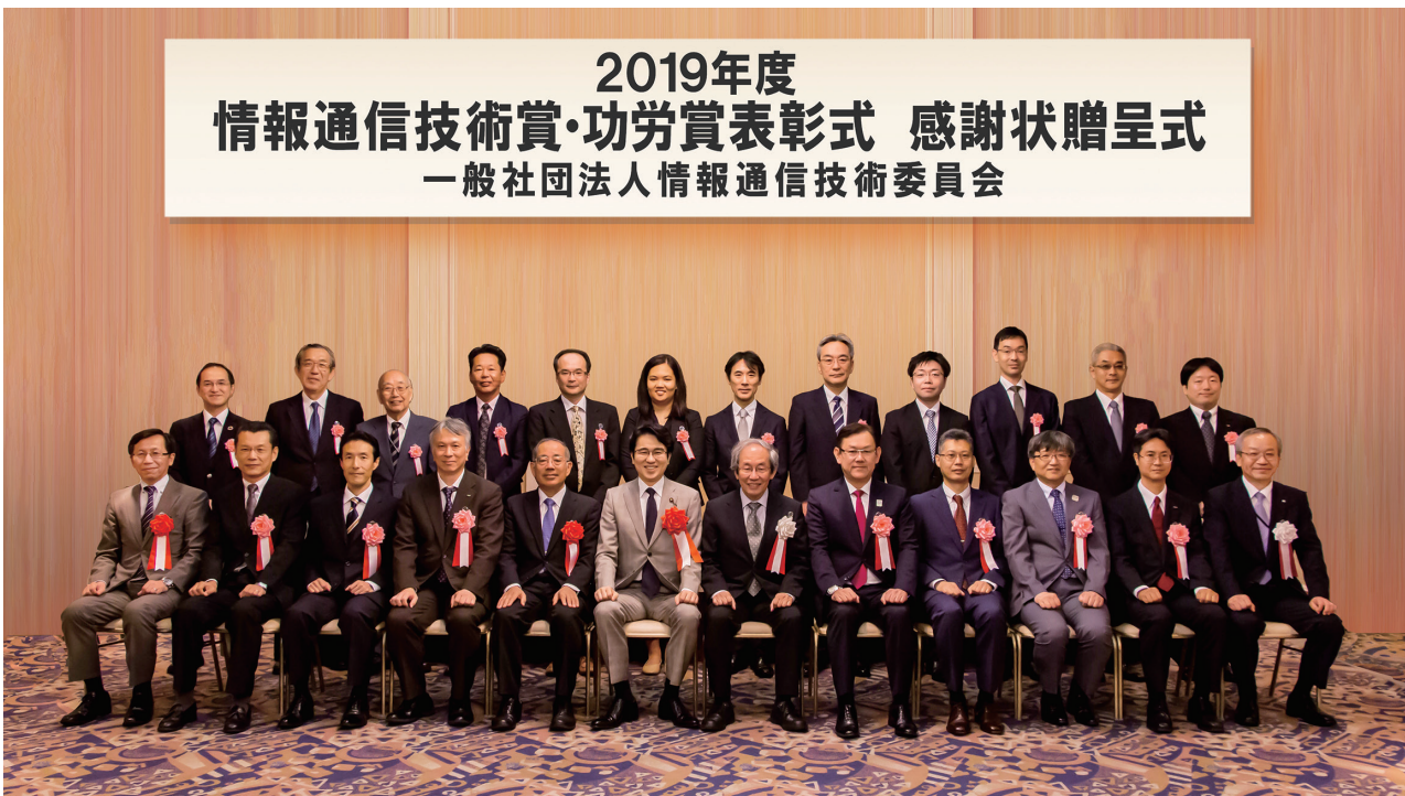
2019年度 情報通信技術賞・功労賞表彰式 感謝状贈呈式 一般社団法人情報通信技術委員会